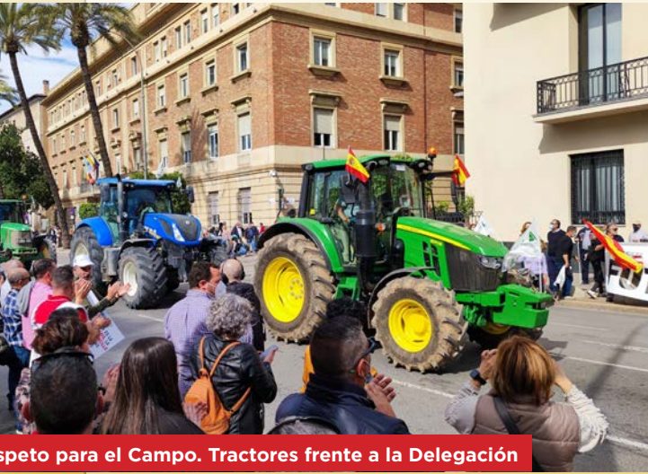
Respeto para el Campo. Tractores frente a la Delegación