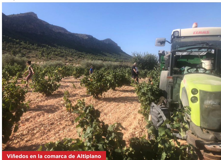
Viñedos en la comarca de Altiplano

En esta jornada conoceremos las novedades del seguro agrario, tanto desde la perspectiva estatal, como desde la óptica de la administración autonómica. Tendremos una visión de detalle del seguro del viñedo , así como informar de otros seguros como son los de olivar, almendro, cereales y ganaderos , así como de las posibilidades que ofrecen los seguros agrarios para los profesionales agrarios del Altiplano.