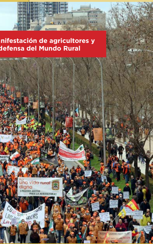
Manifestación de agricultores y defensa del Mundo Rural