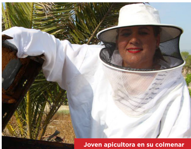
Joven apicultora en su colmenar

El balance de las últimas campañas es realmente preocupante con un descenso de la cosecha de miel que supera el 40 % y a pesar de ello los precios de venta ofertados a los apicultores están por debajo del coste de producción. Pero también porque las colmenas son más difíciles de mantener en condiciones óptimas a causa de las múltiples patologías, problemas ambientales y climáticos. Se necesita cada vez más dedicación y más formación, sólo para mantener vivas las colmenas. El déficit de polinización es la consecuencia más grave del denominado “síndrome de despoblamiento apícola” que provoca en todo el mundo la muerte de millones de colmenas al año . En España, el beneficio en polinización, sólo en el sector agrario, se estima que supera los 4.000 millones de euros anuales, por lo que estamos hablando de un sector de gran trascendencia.