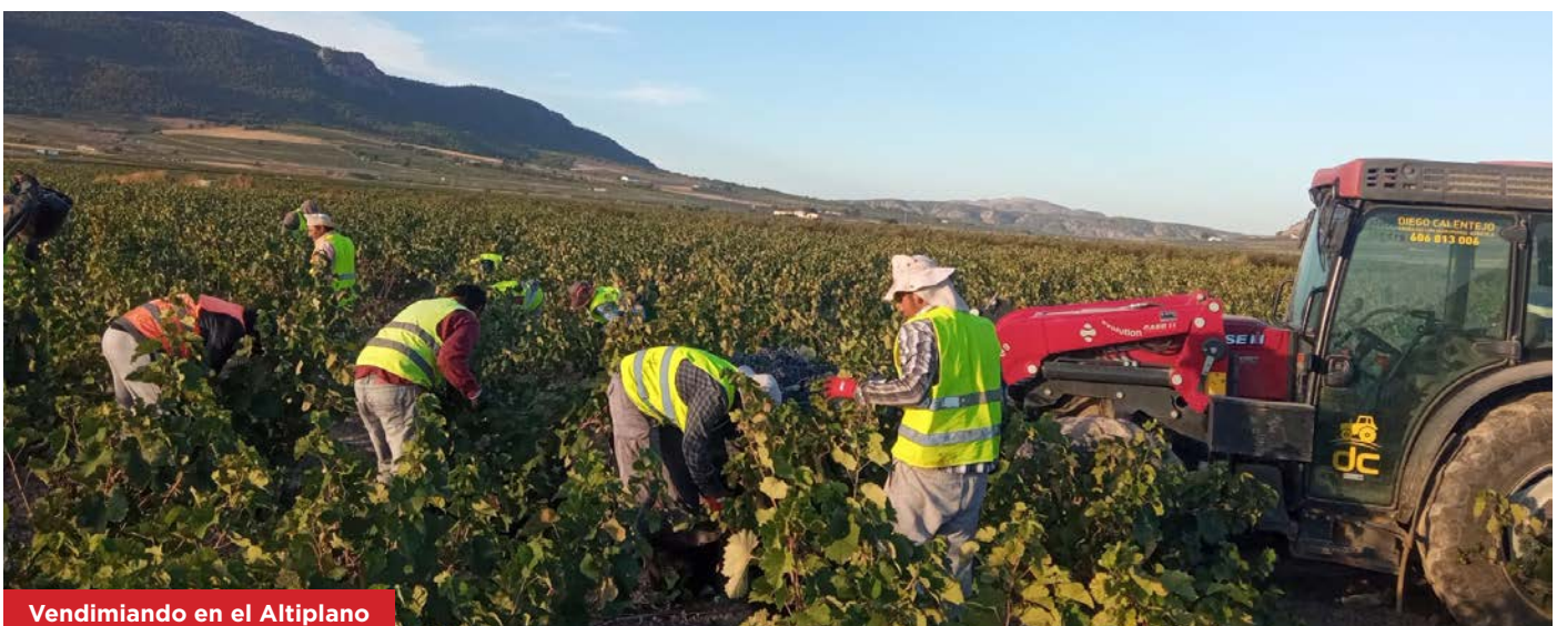
Vendimiando en el Altiplano

Con carácter perentorio, COAG Murcia insta a la AICA a que vele para que los productores logren, al menos, cubrir con sus costes de producción , de otra forma, se acelerara el proceso de abandono de cepas y derechos de producción que se está produciendo en los últimos años, en perjuicio de nuestros entornos rurales y de la economía de la Región de Murcia.