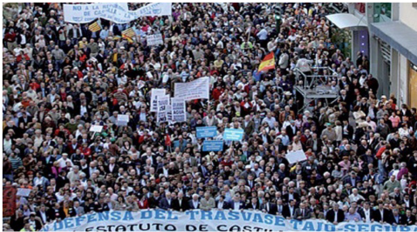
Una de las muchas manifestaciones en defensa del agua