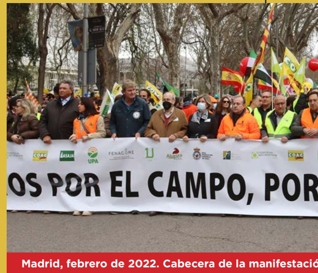
Madrid, febrero de 2022. Cabecera de la manifestación