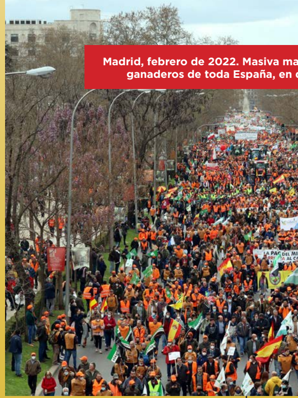
Madrid, febrero de 2022. Masiva ma ganaderos de toda España, en o