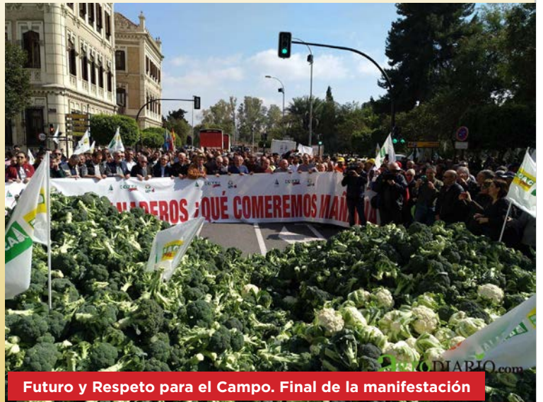
Futuro y Respeto para el Campo. Final de la manifestación