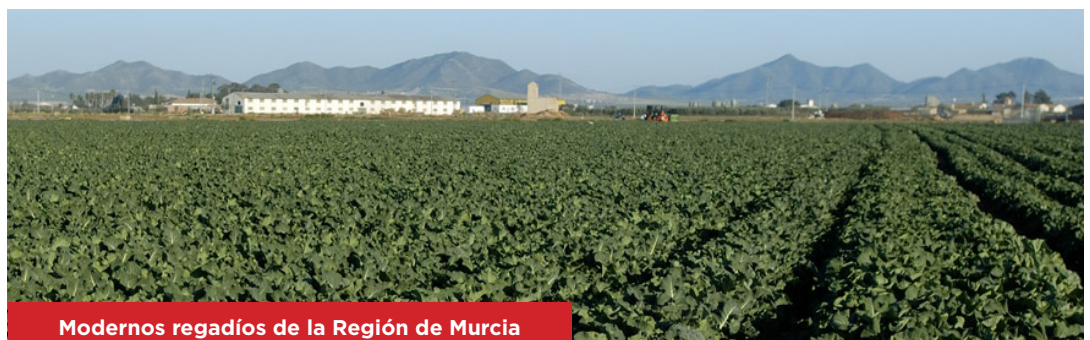
Modernos regadíos de la Región de Murcia

Se ha de acometer la construcción de infraestructuras hídricas que eviten, o al menos disminuyan, los