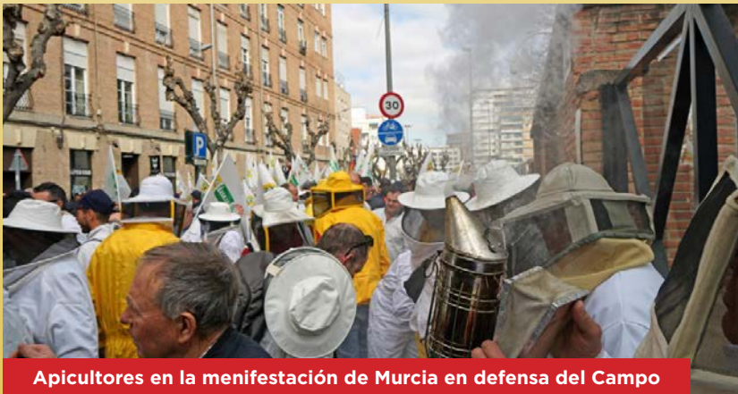
Apicultores en la menifestación de Murcia en defensa del Campo