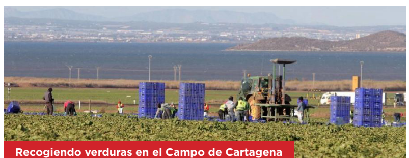
Recogiendo verduras en el Campo de Cartagena

Los agricultores y ganaderos, que han enviado más de 3.000 informes a la CHS, han demostrado su decidida apuesta a la hora de adoptar soluciones que garanticen la compatibilidad entre la actividad agrícola y el mantenimiento del buen estado ecosistémico del Mar Menor.