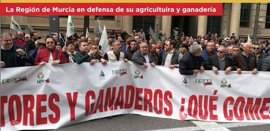
La Región de Murcia en defensa de su agricultura y ganadería