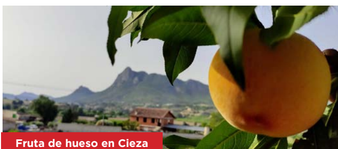
Fruta de hueso en Cieza

En ocasiones, los fenómenos meteorológicos han combinado varios riesgos de manera simultánea, multiplicando los daños y afectando a ámbitos territoriales cada vez más amplios.