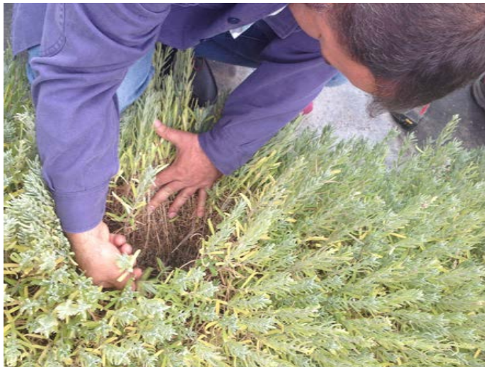
Cultivo del tomillo en las pedanías altas de Lorca

al 300%. También, en estudio del mismo se informó del alto contenido en ácidos grasos Omega-3 de las semillas de plantas aromáticas cultivadas en la Región, lo que puede implicar poder ampliar su aplicación a la industria alimentaria.