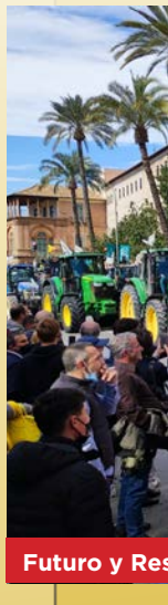
Futuro y Res