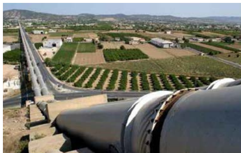
La importancia del Trasvase es mucha

Además, se supervisará el plan de modernización de regadíos