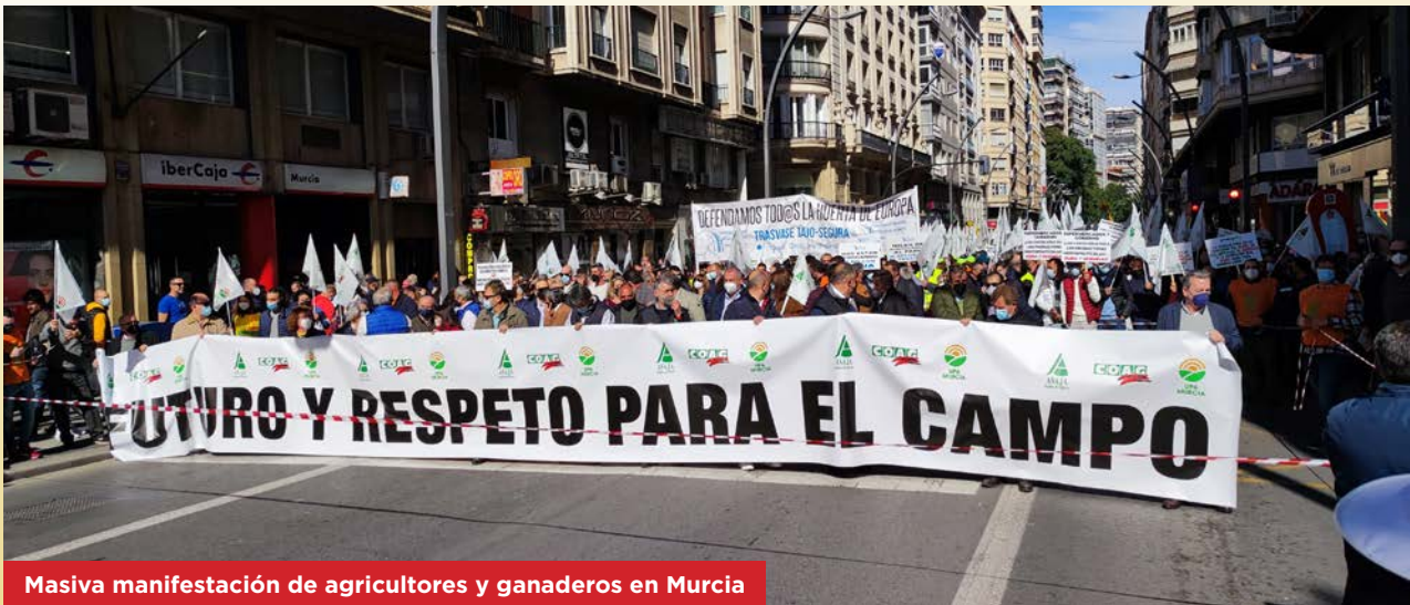
Masiva manifestación de agricultores y ganaderos en Murcia