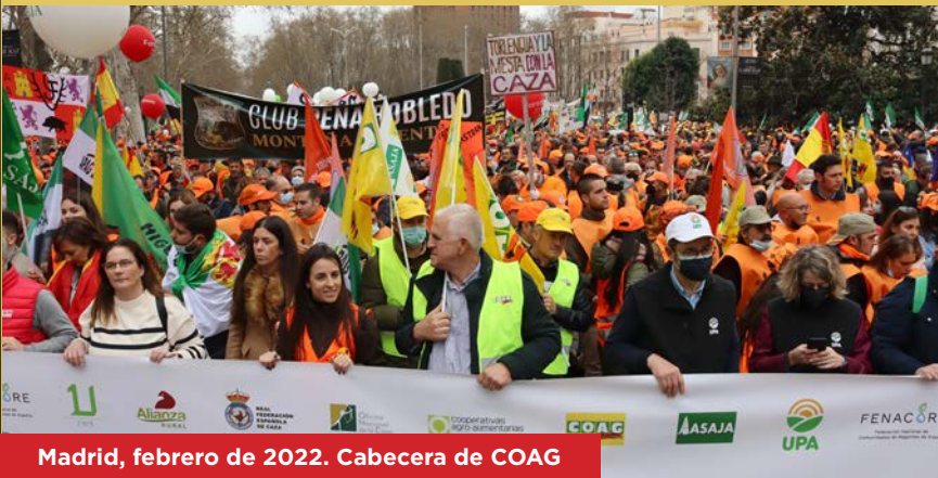
Madrid, febrero de 2022. Cabecera de COAG