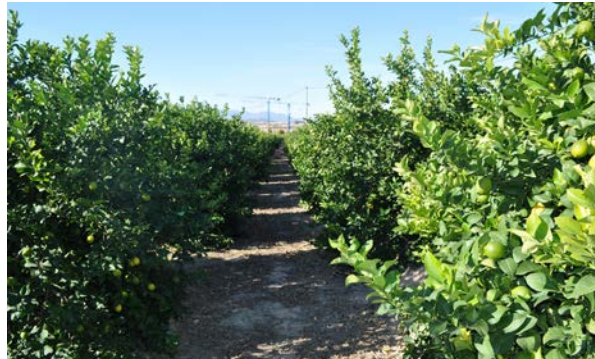
Tradicional cultivo de limoneros

La producción de agua desalinizada en los plazos de vigencia del Plan Hidrológico que se apruebe oportunamente y que lo será hasta el año 27, ha de ser la suficiente para abordar el sostenimiento de la agricultura de regadío en sus dimensiones actuales, excluyendo obviamente los regadíos ilegales. Se ha de procurar, en todo caso, que el coste de dicha agua desalinizada sea el mismo para toda la cuenca, en el entorno de los 0,30 €/m 3 , para que sea asumible para los agricultores regantes, utilizando