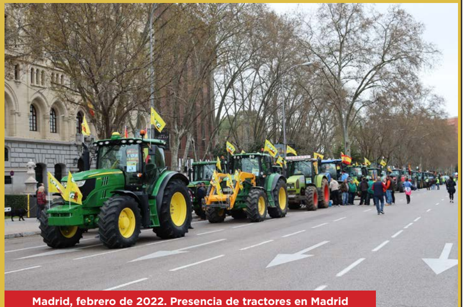
Madrid, febrero de 2022. Presencia de tractores en Madrid